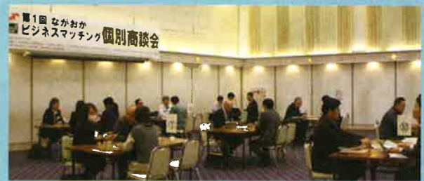
＜商談イメージ (第1回の様子)＞

【主催】長岡商工会議所 【共催】長岡市、(一社)新潟県商工会議所連合会、新潟県商工会連合会、(一社)群馬県商工会議所連合会、富山県商工会議所連合会、(一社)長野県商工会議所連合会、福島県商工会議所連合会、山形県商工会議所連合会、(一社)埼玉県商工会議所連合会 【後援】(株)北越銀行、(株)大光銀行、(株)第四銀行、長岡信用金庫、長岡ものづくりネットワーク