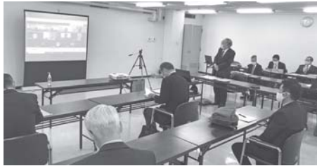
コロナ対策として初の ハイブリッドで開催した常議員会

第581回常議員会が2月25日、オンライン参加を含め役員16名の出席により開催されました。