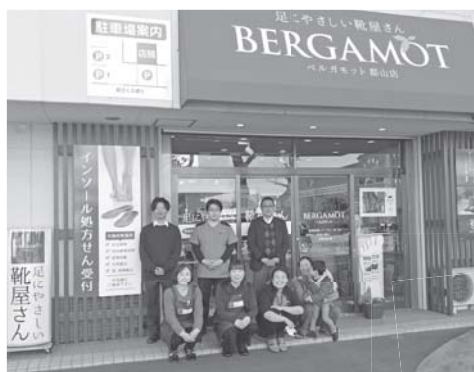
社員一同皆様のお越しをお待ちしております