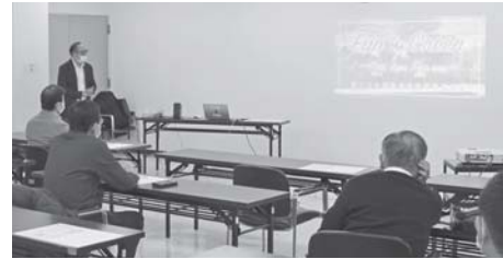
新たな翠ヶ丘公園に期待膨らむ 内容が発信された委員会