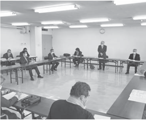
各部会の意見が交わされた会議

また、須賀川市をはじめとする行政に対する要望事項、そして商工会議所に対する要望事項について意見交換され、今後、各部会からの要望事項の集約、そして関係団体との協議を経て、要望活動を実施することを決めました。