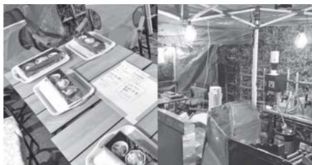
流行りのグランピング感覚で おいしい料理を楽しめました

旅館料飲部会では敬遠される店舗内での飲食ではなく、店舗の外での飲食を推奨し、個店の利用促進を図るイベント「外飯（そとめし）」を開催しました。