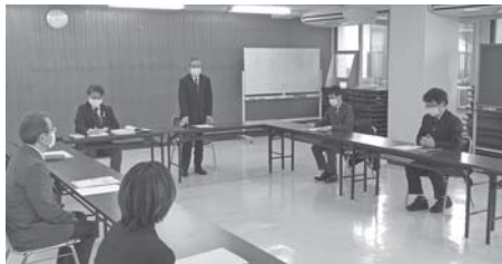
細部の最終確認が行われた委員会

高校卒業予定者を対象とした地元企業説明会の第3回運営委員会が2月8日開催され、参加申し込み状況や収録内容について協議しました。