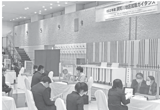
各ブースで活発な面談が行われた

27名が訪れました。 今回は新型コロナウイルス対策として、午前部と午後部に分けて、ソーシャルディスタンスを確保しての開催とし、午前部に13社、午後部に13社が参加しました。