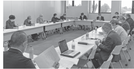
まちづくりに関する意見が 交わされた意見交換会