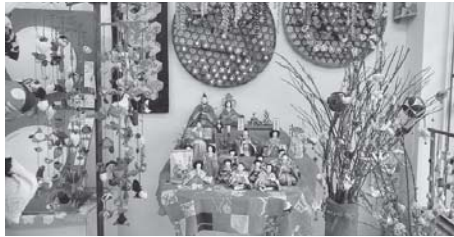
展示優秀店に認定された 白光堂電気店店内

第17回すかがわ商店街雛(ひな)の笑顔に会えるまち」は2月19日～3月3日にかけて開催され、市内外から多くの方々が商店街を訪れ、各店のお雛様巡りを楽しみました。今年度初めて実施したあなたが選ぶお気に入りの展示店で投票数の多かった白光堂電気・久保木畳店・いちかわでんきが展示優秀店に決定しました。また、期間中ご応募いただいたスタンプラリーにつきましては、先般厳選な抽選を行い、当選者へ商品券を発送いたしました。