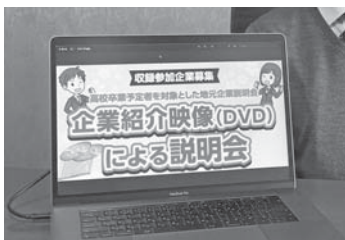
18社が収録された企業紹介映像

今年度の高校卒業予定者を対象とした地元企業説明会は、新型コロナウイルス感染症拡大防止のため、企業紹介を収録したDVD映像による説明会としました。