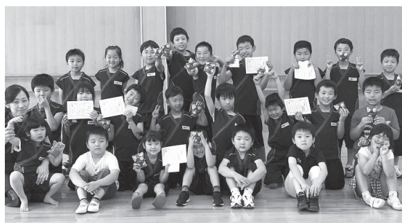
日々練習に励む生徒たち

子供たちの様々な能力を育み、何事にも自信を持ってチャレンジできるように、また、子供たちが将来訪れるであろう試練にも自分の力で進んで行くことが出来るように「自分力」を育てることを指導しています。