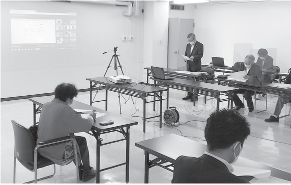
感染防止対策のためオンラインで開催した常議員会

また、新入会員の承認についても審議し、1件が承認されました。これにより当所会員数は1106件となりました。最後に、健康診断・成人病検診の実施等について事務局より報告が行われ終了しました。