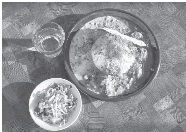
▲3種の味も香りも異なるカレーが食欲をそそります