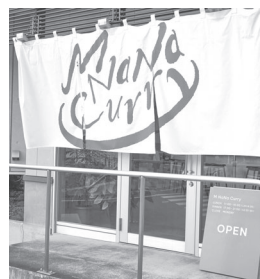
▲おしゃれな暖簾が目を引きます

ご予算に応じたセッティングもできますので、これから活発になる忘新年会にもご利用ください。