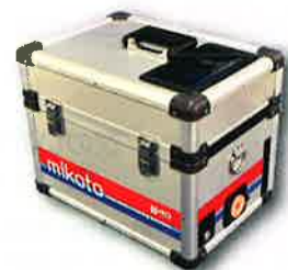
「mikoto」大腸内視鏡モデル

事業成果 令和5年6月15日に製品発表を実施。 令和5年11月時点で数十台の国内販売を実現。